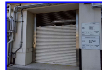
写真 作業エリア・資機材置場②