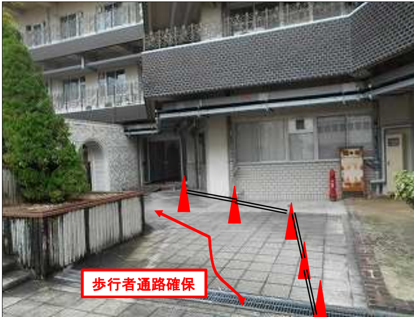
学内作業エリア写真1