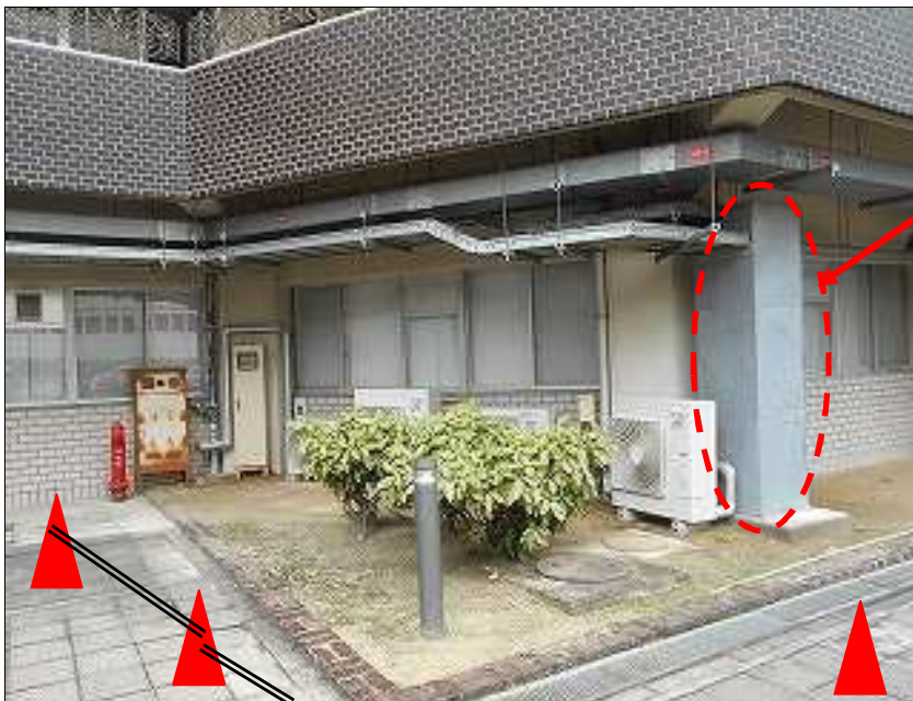
学内作業エリア写真2